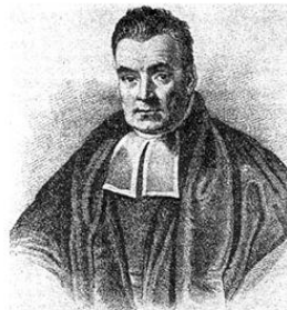
Thomas Bayes (1701-1761)